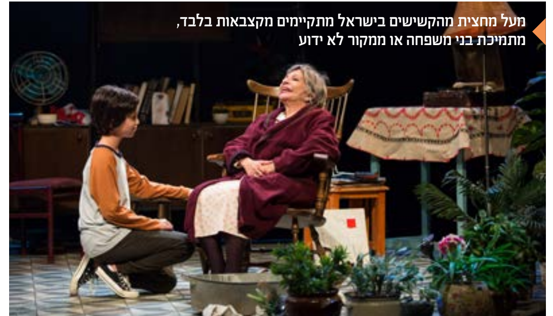
מעל מחצית מהקשישים בישראל מתקיימים מקצבאות בלבד, מתמיכת בני משפחה או ממקור לא ידוע

יליד שנת 2009. משחקת שנה שניה במרכז מצוינות בגודמן בית ספר למשחק בנגב.