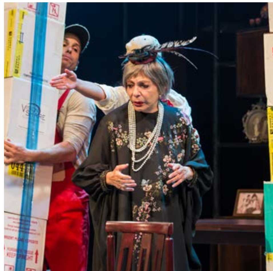
כחצי מבני ה-75 פלוס בישראל מדווחים כי הם חשים בדידות לעיתים קרובות