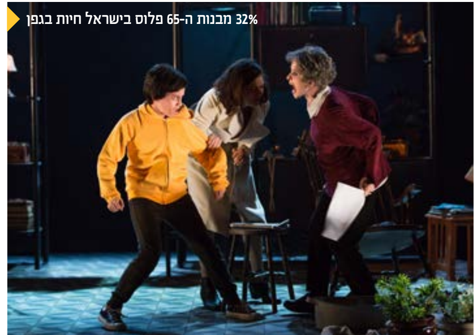
32% מבנות ה-65 פלוס בישראל חיות בגפן