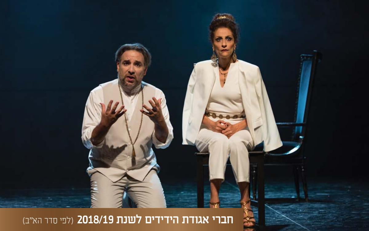
חברי אגודת הידידים לשנת 2018/19 (לפי סדר הא"ב)