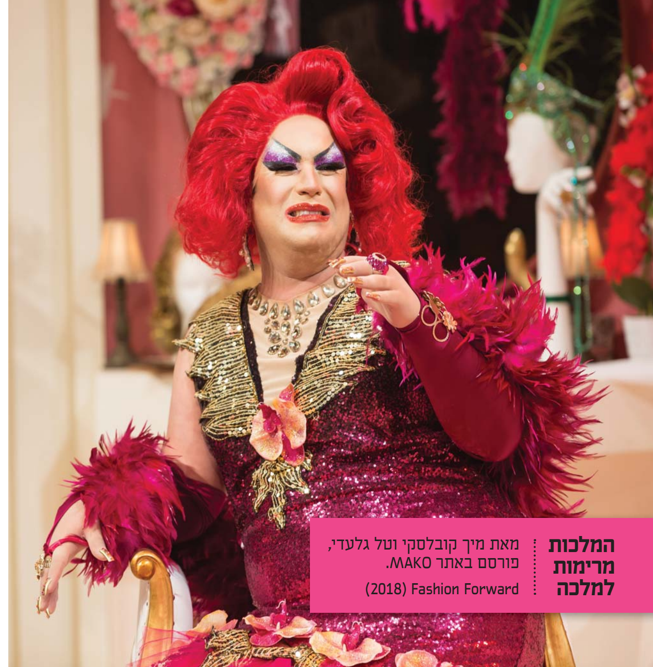
המלכות מרימות למלכה : מאת מיך קובלסקי וטל גלעדי, פורסם באתר MAKO. (2018) Fashion Forward

דבר אחד בטוח, והוא שהדראג מבקש להרחיב את גבולותיו ולשבור את הגדרותיו, משמע הוא קיים. ככה שלא משנה מי אתם, אם עדיין לא עשיתם דראג, זה בדיוק הזמן להיכנס לנעליים הגדולות (במידה 45 אצל חלקנו) של המלכות הוותיקות ולא לפספס את הרכבת. בגרביונים. דיוות אף פעם לא עולות לבמה עם רכבת בגרביונים.