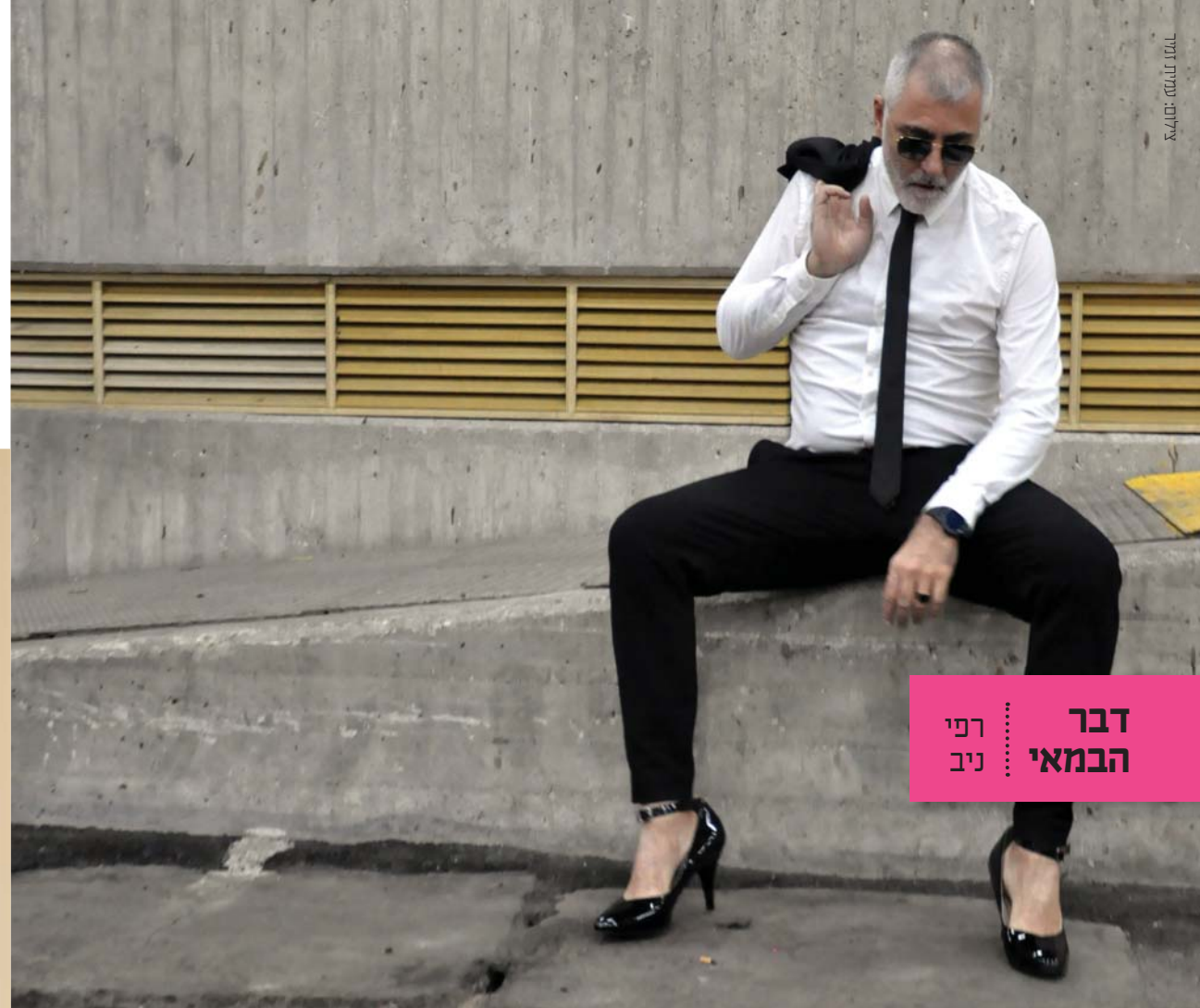
דבר הבמאי : רפי ניב

הקומדיה "כלוב העליזים" מאת ז'אן פווארה, נבחרה לפתוח את עונת ההצגות 2018-19, העונה החברתית. לכאורה - מדובר בקומדיה מסחרית שנכתבה בשנות השבעים ועלתה מאז בהצלחה רבה בכל העולם, זכתה לשני עיבודים קולנועיים מצליחים - צרפתי ואמריקאי ואף עובדה למחזמר מצליח.