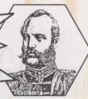
הצאר אלכסנדר ה-2

הצאר אלכסנדר ה-2 נרצח על ידי קבוצה מהפכנית "נרודניה ווליה". היהודים מואשמים ברצח. פרוצות פרעות בעיקר לאורך קווי מסילת הרכבת החדשה ברחבי רוסיה. הפרעות נערכות בעידוד השלטון הרוצה לעודד הגירת היהודים. הצאר אלכסנדר ה-3 מחוקק חוקי אפליה "חוקי מא".