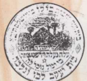
חותם תנועת הסטודנטים ביל"ו.

הקמת תנועת הסטודנטים ביל"ו. רק עשרות מגיעים לארץ ומיד מתפלגים ועוברים לראשון לציון, לגדרה ולירושלים.