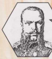
הצאר אלכסנדר ה-3

במחצית השנייה של המאה ה-19 יושבים ברוסיה פולין מחצית מיהודי העולם (6 מיליון בערך) 90% מהם ב"תחום המושב". במשך המאה ה-19 מנסים השלטונות לשלב את היהודים בחברה ובכלכלה הרוסית. ניקולאי הראשון עושה זאת ביד קשה, אלכסנדר ה-2 בדרכי נועם. מתרחש תהליך מודרניזציה. צומחת שכבת משכילים יהודים המנסה להתערות בחברה הרוסית. בד בבד צומחת גם ספרות ועיתונות עברית.