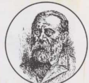
יהודה ליב פינסקר

פינסקר מפרסם את "האוטומוניפיציה": שחרור עצמי של העם היהודי ע"י רכישת טריטוריה.