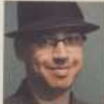
סיני מתנת זכימו