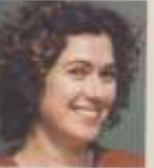
דלית שבת ת לבו שות