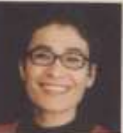
לילי בן זשורן ת טו א ו ר ת

בוגרת לימודי אסטוט ב'בעלמל' ובוגרת לימודי