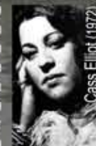
Cass Elliot (1972)

היתה להקת רוק-פולק הרמוני שפעלה כשנות ה-60 בארצות הברית.